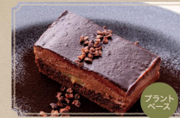
濃厚ショコラテリーヌ 790 (税込869) Rich Chocolate Terrine 植物由来の濃厚チョコテリーヌ