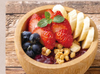
ベリーベリー 950 (税込1045) Berry Berry