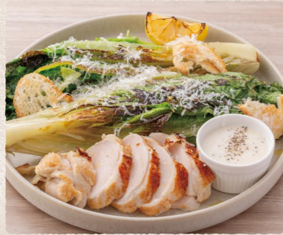
ローストチキンの グリルドシーザーサラダ 1300 (税込1430) Caesar Salad with Grilled Roasted Chicken