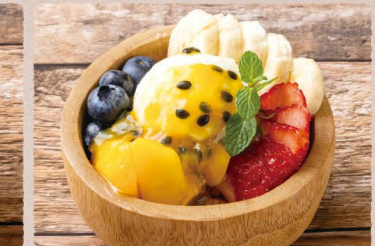
アイランドヨーグルト 980 (税込1078) Island Yogurt フルーツ5種+グreekヨーグルト