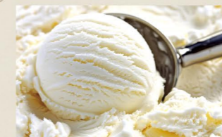
サステナブル ジェラート ALL 500 (税込550) Sustainable Gelato