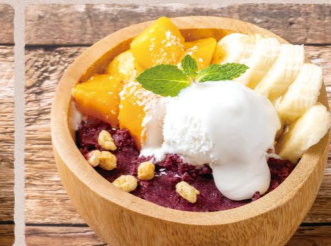
ココナツマンゴー 930 (税込1023) Coconuts Mango