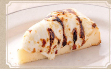
ブリュレチーズケーキ 780 (税込858) Bruleed Cheesecake マスカルポーネの香ばしいブリュレ