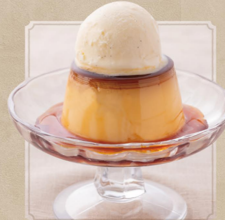
クラシックプリン 730 (税込803) Classic Pudding 昔ながらの固めの王道プリン