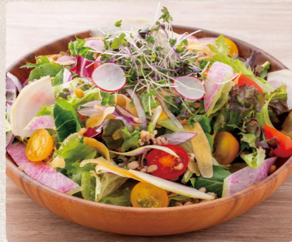
季節野菜のガーデンサラダ 1100 (税込1210) Seasonal Vegetable Garden Salad