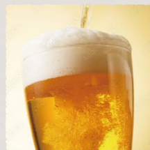
ピルスナー 980 (税込1078) Pilsner